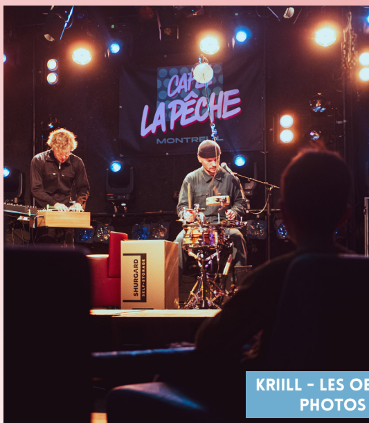
KRIILL - LES OBJETS SONORES DU 93