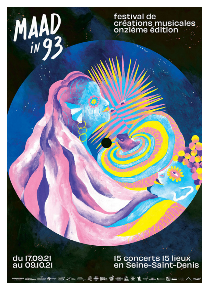
Affiches MAAD IN 93 / 11ème édition. Illustration : Laho Graphisme : Studio Aperçu