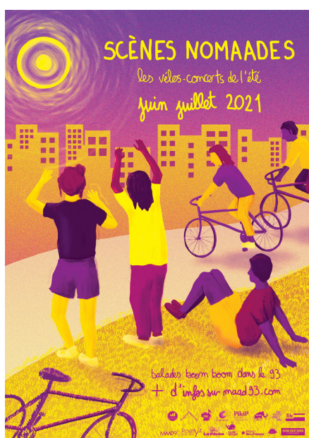
Affiche Scènes Nomaades 2021 / Illustration + graphisme : Justine Adam

→ Depuis l'été 2021, les Scènes Nomaades, scènes mobiles et cyclables (une rosalie et deux vélos-remorques), proposent une expérience sonore itinérante et ludique dans le 93.