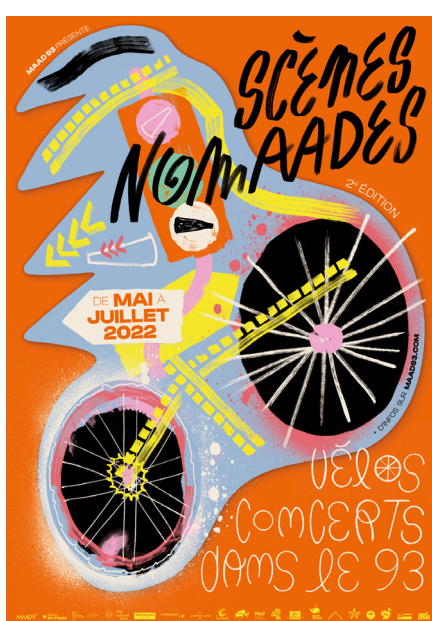
Affiche Scènes Nomaades 2022 Illustration + graphisme : Justine Figueiredo et Clara Gaëet